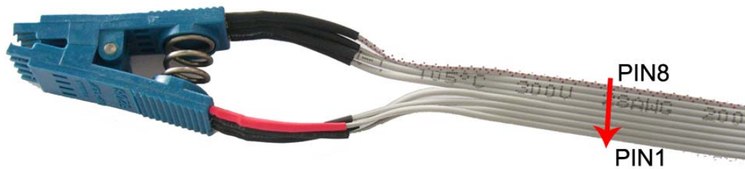
图 3: 完成