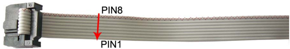
图 2: 线序